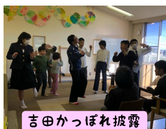
吉田かっぱれ披露