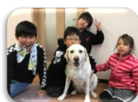
パンビちゃん来所

今年の干支は『イノシシ』大きさに驚く子、どのように 作られているのか、お腹の間から覗いている子もいました。