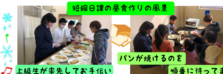
短縮日課の昼食作りの風景