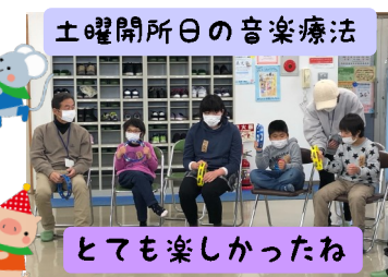
土曜開所日の音楽療法