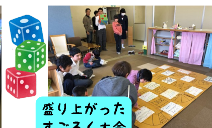
盛り上がった すごろく大会