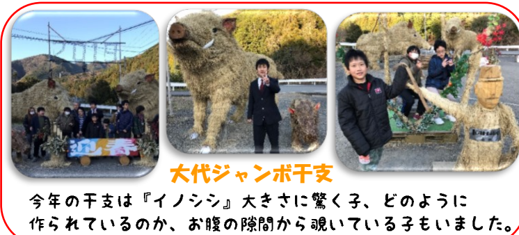
大代ジャンボ干支

今年の干支は『イノシシ』大きさに驚く子、どのように 作られているのか、お腹の間から覗いている子もいました。