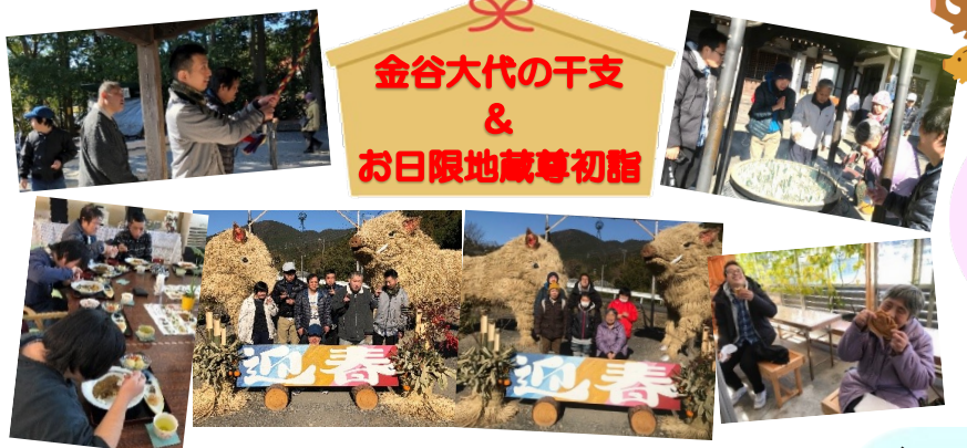
金谷大代の干支 & お日限地藏尊初詣