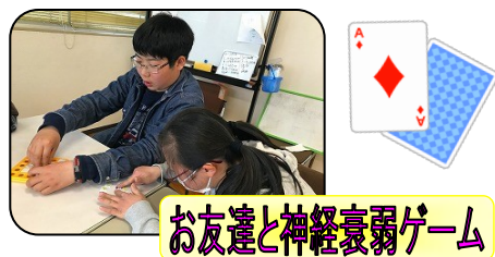
お友達と神経衰弱ゲーム