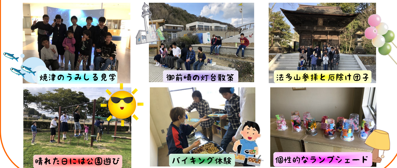
焼津のうみしる見学

坂口では新中学生3名・新高校生4名がいらっしゃいます。大きな環境の変化で戸惑う事もあるかと思いますが、スタッフ一同、お子様たちが笑顔で過ごせる支援に努めて参ります。お気づきの事がございましたらご連絡下さい。