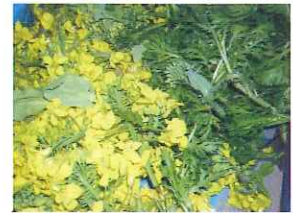
畑では、春野菜の収穫が真っ盛りです！

4月初日、藤枝特別支援学校の卒業生2名を迎え、「かりん」入所式を行いました。今日から大人として社会の一員に加わった仲間と共に利用者さん皆が、気持ちを新たにしました。スタッフたちも、これから毎日元気に「かりん」に通ってもらえたらと、願っています。