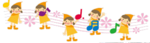
みんなでハンドベル♪