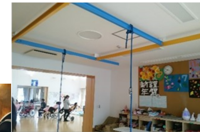
天井に組み込まれたブランコ