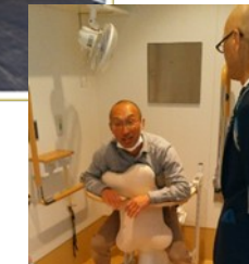
持つところを大きくしたら、自分でトイレができます

各所にアイデアが取り入れられていて、非常に参考になりました。4つあるトイレは利用者さんに合う工夫がされた設備でしたし、活動室の天井から下がっているブランコも利用者さんに喜ばれているそうです。送迎は基本的に保護者さんがされているとのことでした。保護者会を通じて事業所と保護者が良好な関係をつくられている印象でした。