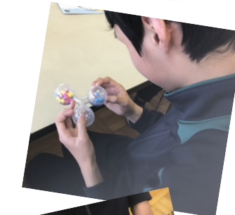
ムービングボール