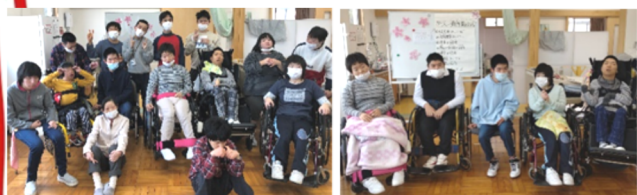
4月1日ウェルカム式

今年は4月から新しく4名の利用者をお迎えしました。みんなで楽しく活動していきます。