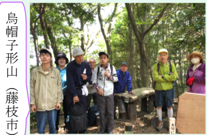
烏帽子形山(藤枝市)