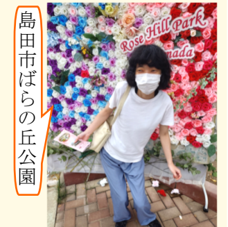
島田市ばらの丘公園