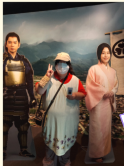
静岡 大河ドラマ館