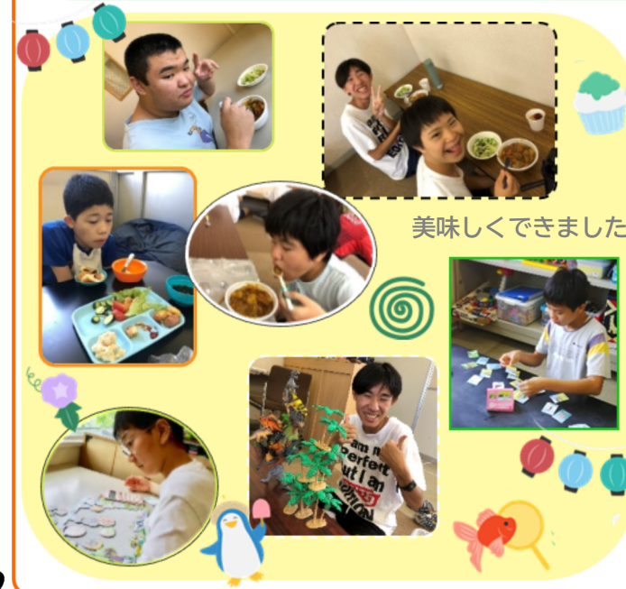
美味しくできました

夏休みの予定表でわかりにくいところもあったようで、ご迷惑をおかけして申し訳ありませんでした。わからないこと、また困りごとなどありましたらぜひお知らせください。よろしくお願い致します。