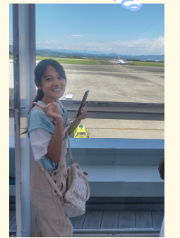
ヤマハコミュニケーションプラザ(磐田市)