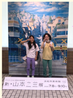
浜松市美術館にて

さて、平素は居宅事業にご理解、ご協力を頂きありがとうございます。この度「おれんじ柳町」が中溝事務所に移転することに伴い、居宅事業が柳町に移転する運びとなりました。移転日程につきましては、詳細が決まり次第お伝えします。移転にかかる期間中は何かとご不便をおかけすることもあるかと思いますが、何卒ご了承のほどよろしくお願いいたします。