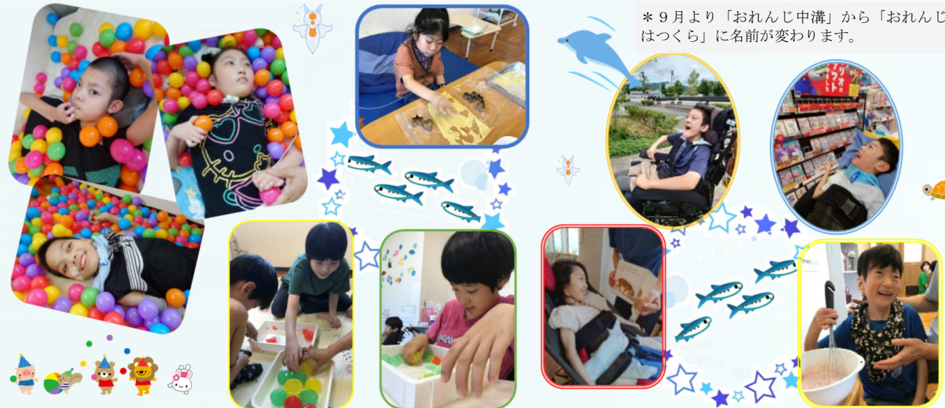
* 9月より「おれんじ中溝」から「おれんじはつくら」に名前が変わります。

夏休みには、アピタやKADODE大井川、図書館や、室内では寒天遊びやクッキングなどをして過ごし、みんなの笑顔がたくさん見ることができました。暑くてなかなか外気に触れることができなかったのですが、今からは気持ちの良い秋の日に、みんなで初倉近所探検に行きたいと思っています。