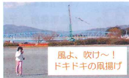
風よ、吹け～！ ドキドキの凧揚げ