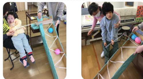
長期休み恒例ボーリング大会!!

入学・進級おめでとうございます。暖かく気持ちのよいぽかぽか陽気と共に、新年度がスタートしました。今年度も子どもたちが安心して過ごしながら、楽しい経験ができるよう心掛けてまいります。よろしくお願いいたします。