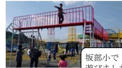
坂部小で遊びました