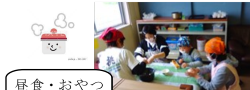
昼食・おやつ作り