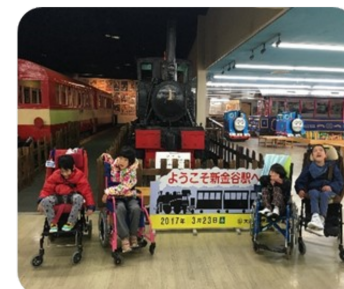
SLとトーマスを見に金谷のロコプラザに行ってきました♪