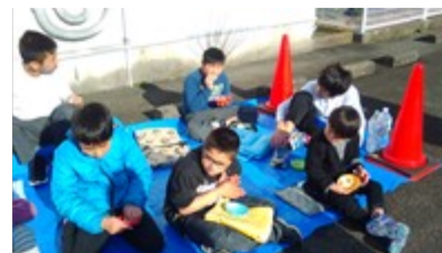
避難所体験として、屋外で非常食を食べました