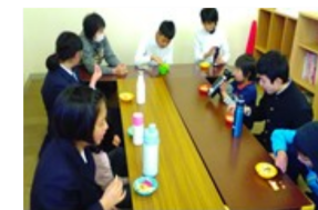
バレンタインのおやつは勿論チョコ