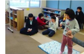
的を倒した数で競争しました！