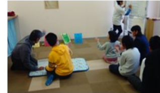
鬼的当てで厄払い☺