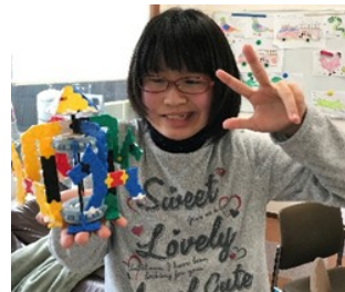
LaQで作ったメリーゴーランド