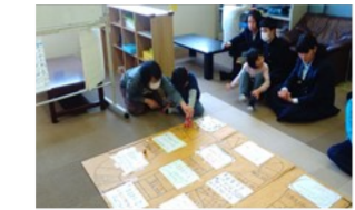
大型すごろくで数のお勉強♡